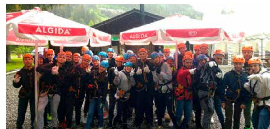
Sopra: studenti, docenti e istituzioni coinvolti in progetti e attività