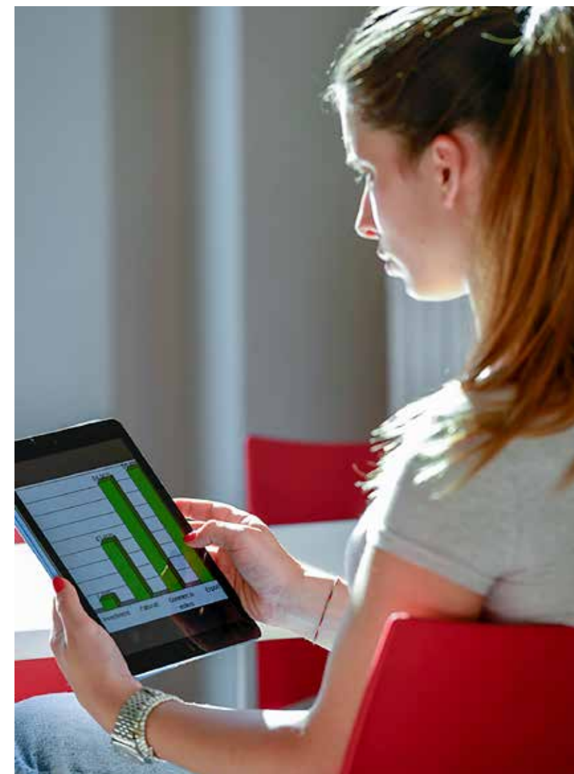
Sopra: una studentessa dell'Istituto Piamarta